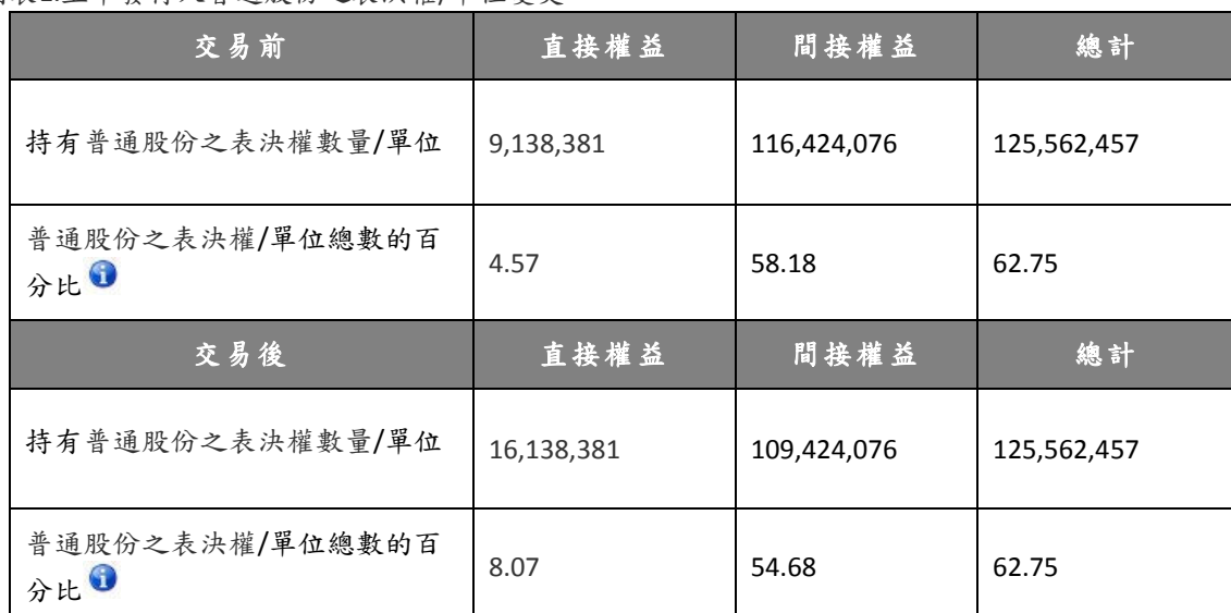
圖表1.上市發行人普通股份之表決權/單位變更

請完成下表（例子：如上市發行人普通股份之表決權/單位變更需完成圖表1，如有關債權變更需完成圖表4）：